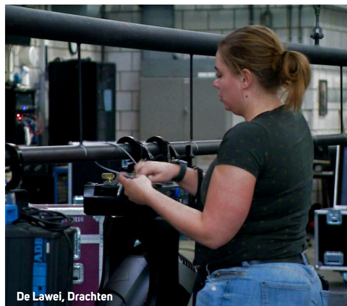
De Lawei, Drachten

“Uiteindelijk kwamen er zo'n honderd mensen.”